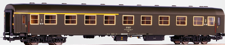
97609 Wagon pasażerski 104Af, 1/2 kl. PKP, st. Łódź Fabr. ep. IVc