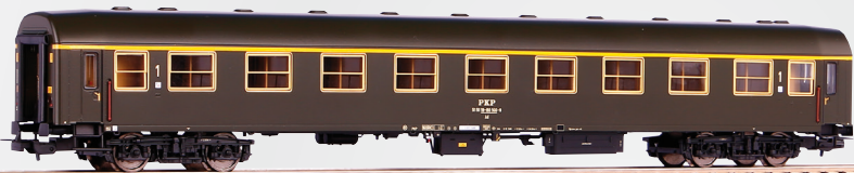
97603 Wagon pasażerski 1 kl. typu 112A PKP, stacja Łódź Fabryczna, ep. IV