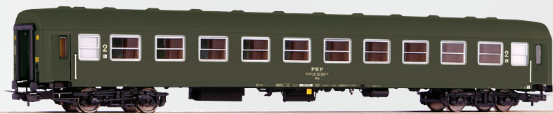
97610 Wagon pasażerski 111Ap PKP, 2 kl. Łódź Fabr. ep. IV