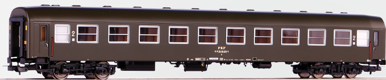
97602 Wagon pasażerski 2 kl. typu 111A PKP, stacja Łódź Fabryczna, ep. IV